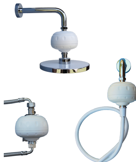
LEGIO-FLD Ball Inlinefilter