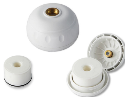
LEGIO-FLD icf Wechselkartusche