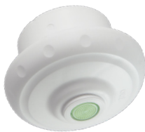
LEGIO-FLD Ball Kartuschenset mit aseptischem Strahlreglereinsatz