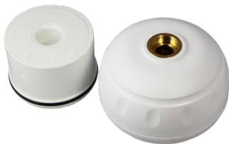
LEGIO-FLD Ball Waschtisch Startset mit aseptischem Strahlreglereinsatz